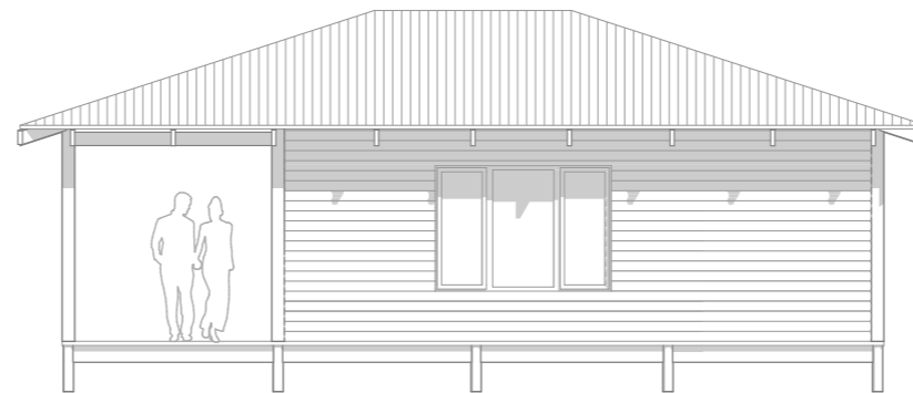
ALCADO LATERAL ESQUERDO