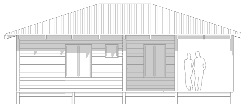
ALCADO LATERAL DIREITO