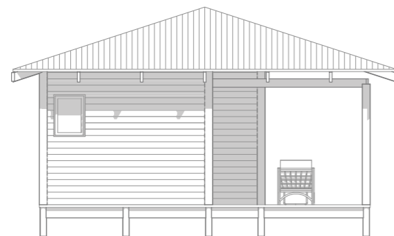
ALCADO LATERAL DIREITO